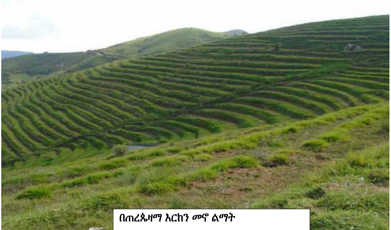
በጠረጴዛማ እርከን መኖሩ ልማት

❖ በዘመናዊ እንስሳት መኖሩ ህገ 162 ሄ/ር የተሸፈነ ሲሆን ለድለባ፣ ወተት ምርትና እንደ መኖሩ ማባዛት ጣቢያነት እያገለገለ በተጨማሪም አጭዶ ለመመገብ በዓመት ሦስት ዙር እስከ 12000 ብር በመሸጥ የገቢ ምንጭ እየሆነ ይገኛል።